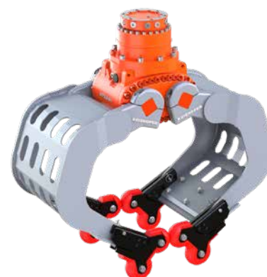
optionale 4-Grip Ansteckvorrichtung, hier angebaut an einem D06HPX