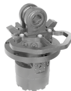
KM 10 F275-50