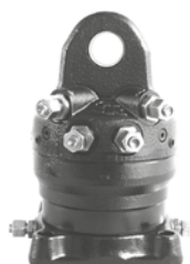
KM 06 F140-40