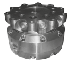
KM 15 F 273/273