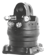
KM 04 F USE