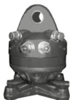
KM 04 F