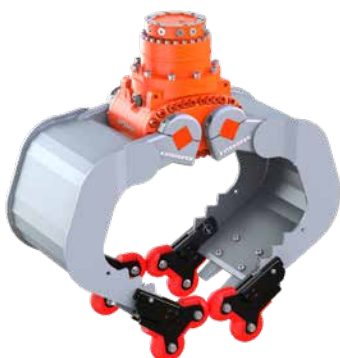
en option: 4-Grip, ici avec A06HPX