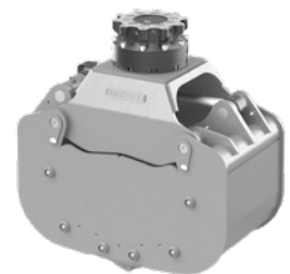
Optionnel: panneaux latéraux vissés