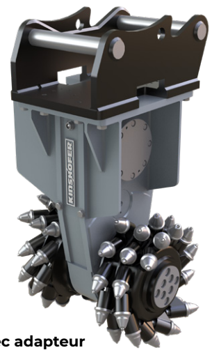
ici avec adaptateur pour attache rapide