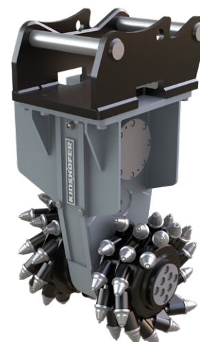
ici avec adaptateur pour attache rapide