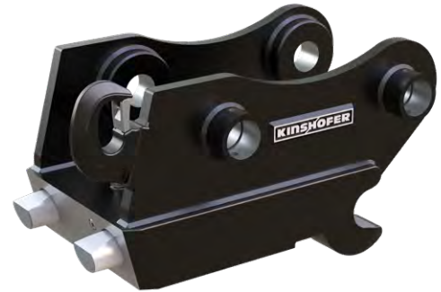
KHS08L ici avec crochet